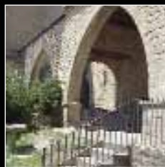
Lonja medieval de Sos