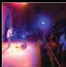
Steve Earle actuó en España –Sos, Luna Lunera, 2003– por primera vez.

Ello contribuirá a potenciar el trabajo ya iniciado en 2003 de productos turísticos completos que incluyen visitas guiadas, actividades como rafting y otras de aventura durante el día , y en definitiva engarzar la oferta del festival con una oferta completa en la que se les organiza desde el alojamiento hasta las visitas, entradas, etc.