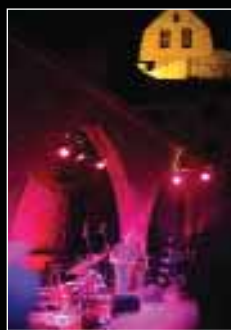
La espadana de la iglesia de san esteban (s. XII) preside el escenario.