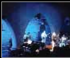
Moustaki se deshizo en elogios acerca del encanto de Sos

El precio incluye el recargo por la venta en la red ticktackticket, a través de internet – www.ticktackticket.com / www.festivales.com –, por teléfono o en cualquiera de los puntos de venta habituales en las principales ciudades de España, así como en la Villa de Sos donde se instalará un punto on line de venta anticipada.