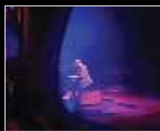
Bebo Valdés, el año pasado; éste, actuará su hijo.