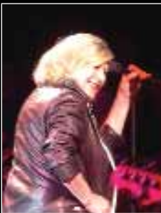
Marianne Faithfull acabó su concierto, a pesar de lesionarse un tobillo.