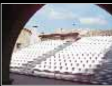
El aforo de la Lonja es de 450 personas, cómodamente sentadas.

Pero Luna Lunera es un evento que no sólo llena al completo la Villa de Sos sino toda la infraestructura de su comarca y la vecina Navarra, los establecimientos de Uncastillo, Sádaba, Sangüesa o la Val d'Onsella se llenarán estos días con espectadores de los conciertos. Para facilitar el alojamiento y las reservas se ha dotado una oficina exclusiva de información y reservas que podrá, no sólo resolver dudas o facilitar informaciones sino buscar y reservas directamente plazas hoteleras o incluso productos completos, incluyendo entradas, visitas a museos, comidas, etc.